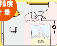
Aの空間を流れる玄米の重量分だけ早くシャッターが作動します。