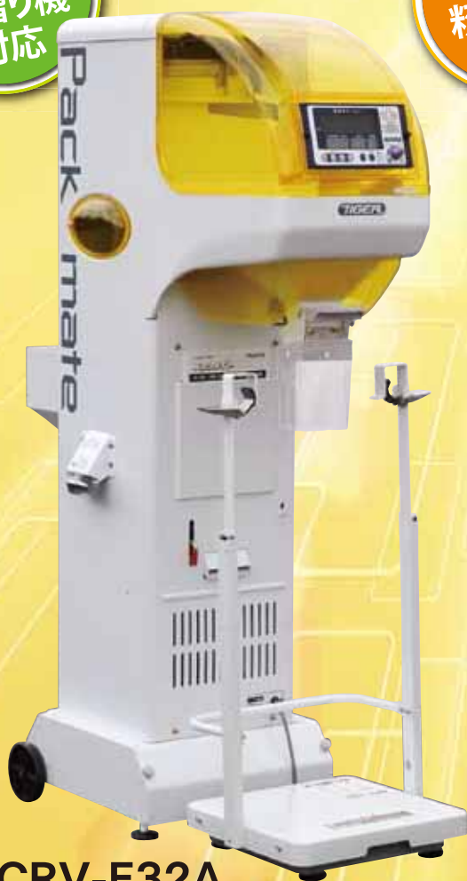
CRV-E32A ¥330,000 (税抜)