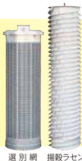
選別網 揚穀ラセン

選別部をたてに配置した、場所をとらないコンパクト設計。お米を揚穀するリップ付きラセンと精密な選別網(精度±3/100mm)のコンビで一粒一粒を確実に選別します。