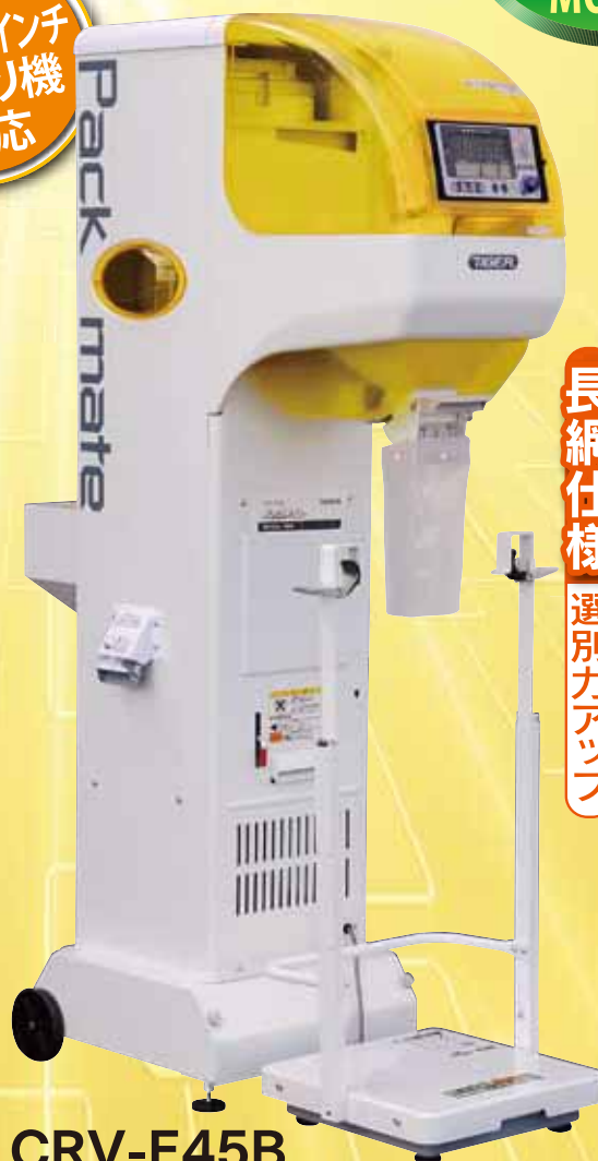
CRV-E45B ¥430,000 (税抜)